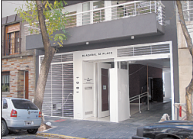
HOMENAJE | EL PORTICO DE ENTRADA, UN PLANO BLANCO DE ACCESO, COMO EN LA CASA CURUTCHET.

Desde el acceso en la planta baja abierta al exterior se ve el patio que sirve como espacio de cochera cubierta y semicubierta. Esta superficie cuenta con Garden Block, bloques de cemento rellenos de césped que promueven la sensación de estar entrando a una casa con jardín . En el hall de