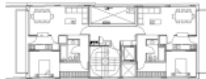
PLANTA TIPO PISOS 1° A 6° |

Por otra parte, la portería se generó en el primer piso al contra frente, para que los propietarios